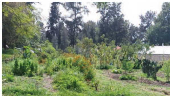
Aspecto actual de la Unidad Agronómica del CIBAC-UAM-X. Campo abierto con siembra de hortalizas y cempasúchil, árboles de colorín, siembra de maíz y frijol nativo, nopales e invernadero.

de los canales de Xochimilco con el objetivo de proporcionar agua de mejor calidad química, principalmente para la propagación de ajolotes de la especie nativa Ambystoma mexicana ya que el CIBAC-UAM-X cuenta actualmente con la categoría de UMA (Unidad Medio Ambiental) para la propagación e investigación de esta especie, además poder contar con agua de mejor calidad para el riego de plantas del área agrícola, que hasta la actualidad se sigue usando.