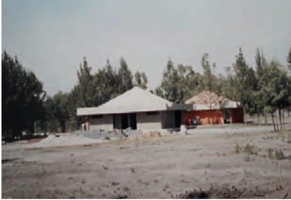
Aspecto del CIBAC cuando se donó a UAM-X (Noviembre 1994). Inicia la construcción del salón de usos múltiples, oficinas y baños.

de las áreas que comprendería este centro, con sus respectivas funciones y actividades a desempeñar. Presenté el plano de las áreas agrícolas que aún se conservan en este espacio: un área de campo abierto para la siembra de plantas cultivadas, donde los estudiantes siembran principalmente hortalizas; se tiene un surco de árboles de durazno donde se hacen prácticas de poda e investigaciones modulares para diagnosticar enfermedades y plagas que atacan a este cultivo, también se cultivan algunos árboles de colorín para estudios de aportación de materia orgánica al suelo.