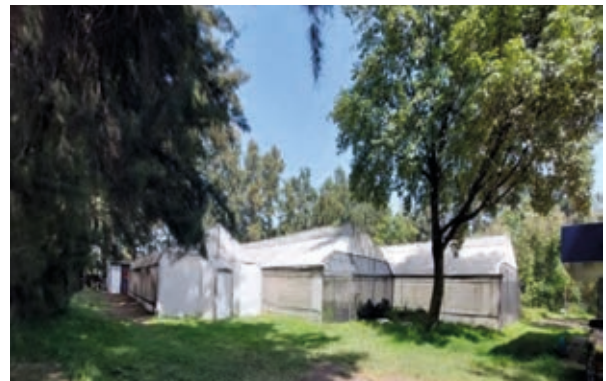
Invernaderos próximos a las oficinas generales, al fondo laboratorio techado.

Un ejemplo interesante de esta vinculación fue la construcción del humedal artificial ubicado en esta área agrícola cerca del canal de Cuemanco, donde se realizó un convenio con investigadores de la Facultad de Química de la UNAM quienes necesitaban un sitio donde probar su sistema de reducción de nutrientes de agua proveniente