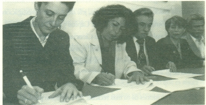
Autoridades de ambas instituciones signan el convenio.