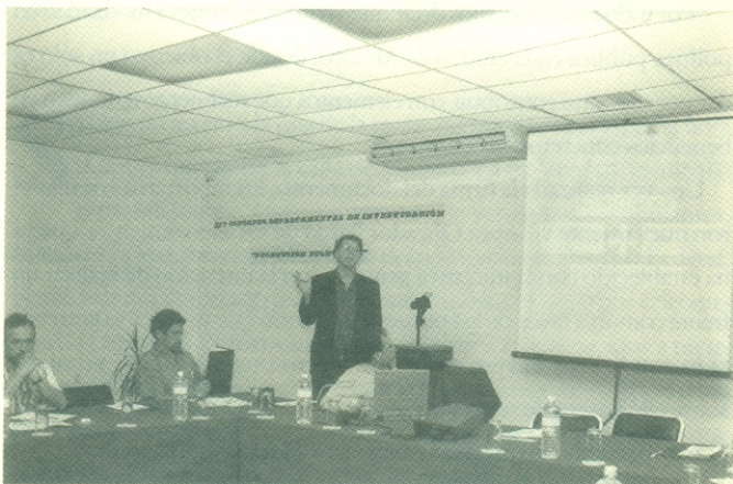
Profesores participantes en el Congreso Departamental de Producción Económica