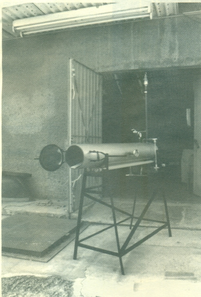
Aparato para estufar madera

El arquitecto Vilchez consideraba que la fabricación de este laboratorio para maderas ayudaría a desarrollar, a un costo económico, dos principales funciones: conocer en las especies maderables nacionales su capacidad de doblado o curvado para clasificarla y ponerla al servicio de la industria pues en México no existe la cultura del estufado ni el curva-