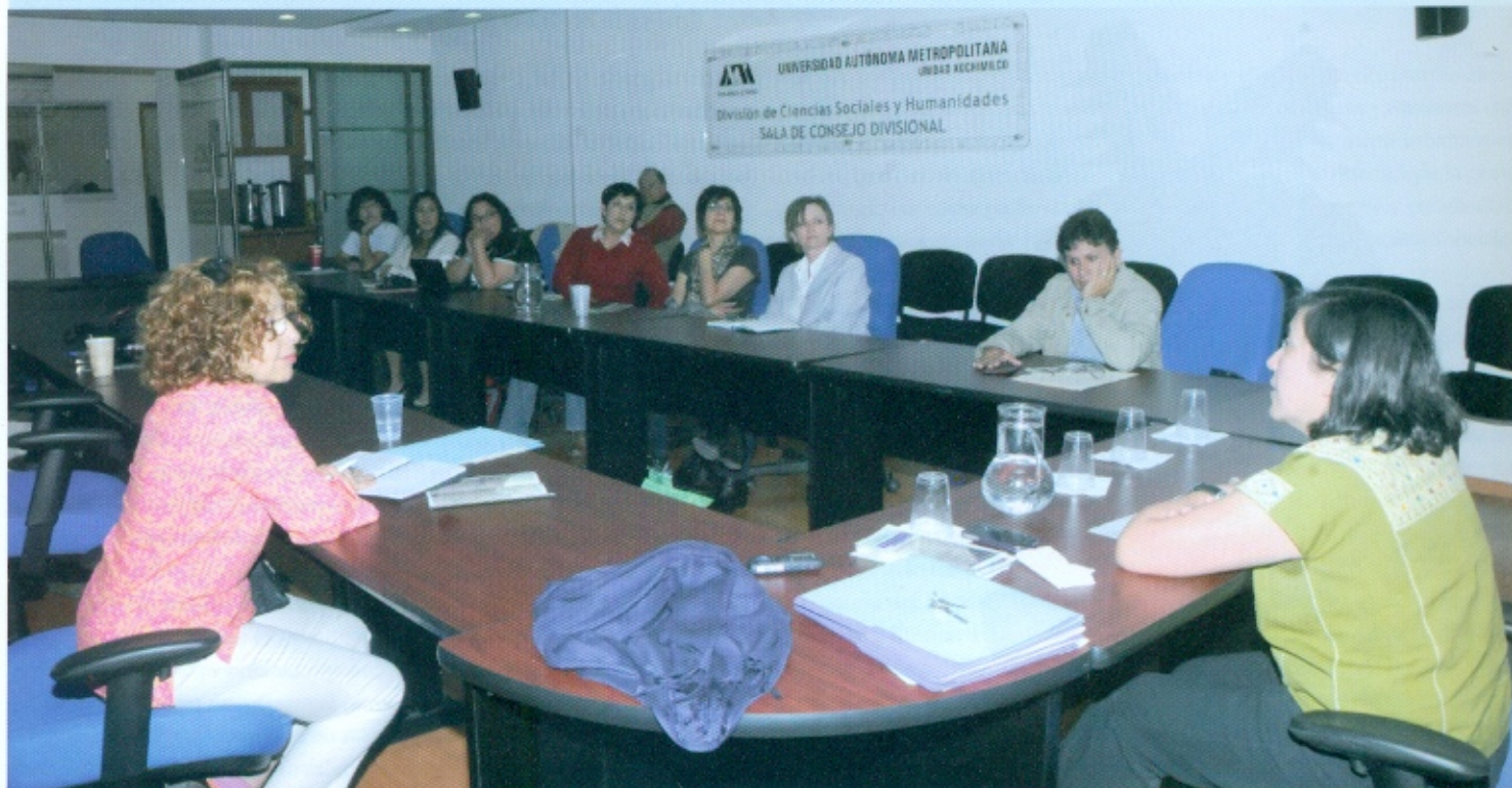
Reunión de egresadas y egresados en la sala Xochicalli de la División de Ciencias Sociales y Humanidades.

EL POSGRADO EN ESTUDIOS DE LA MUJER LLEVÓ A CABO SU PRIMER ENCUENTRO de egresadas y egresados con el objetivo de construir una relación más estrecha lo que permitirá conocer su desempeño profesional y personal, así como fortalecer los vínculos con la institución mediante actividades comunes que retroalimenten el posgrado y que esto promueva, potencialice y actualice su compromiso social.