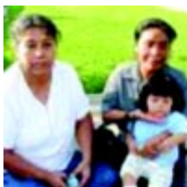
La salud de quienes se quedan Pág. 9