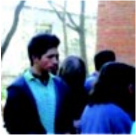
Discriminación entre jóvenes Pág. 4