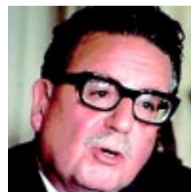
Allende, un hombre comprometido Pág. 13