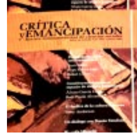
Crítica y emancipación, conceptos atípicos Pág. 8