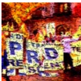
El PRD: un cóctel de fuerzas Pág. 11