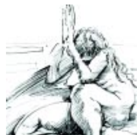
Figura humana en fusión armoniosa Pág. 15